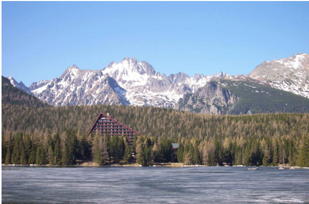
Miesto konania konferencie hotel Patria - Štrbské Pleso.