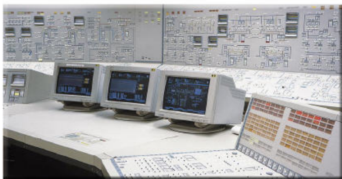
automatizácia - elektrosystémy - meranie - regulácia